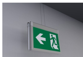
Zubehör für Pendelmontage mit Seil A-1136 (optional)