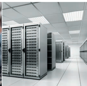
Industrieanlagen und Rechenzentren