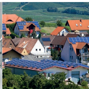
LEC Zusammenschluss lokaler Energiegemeinschaften